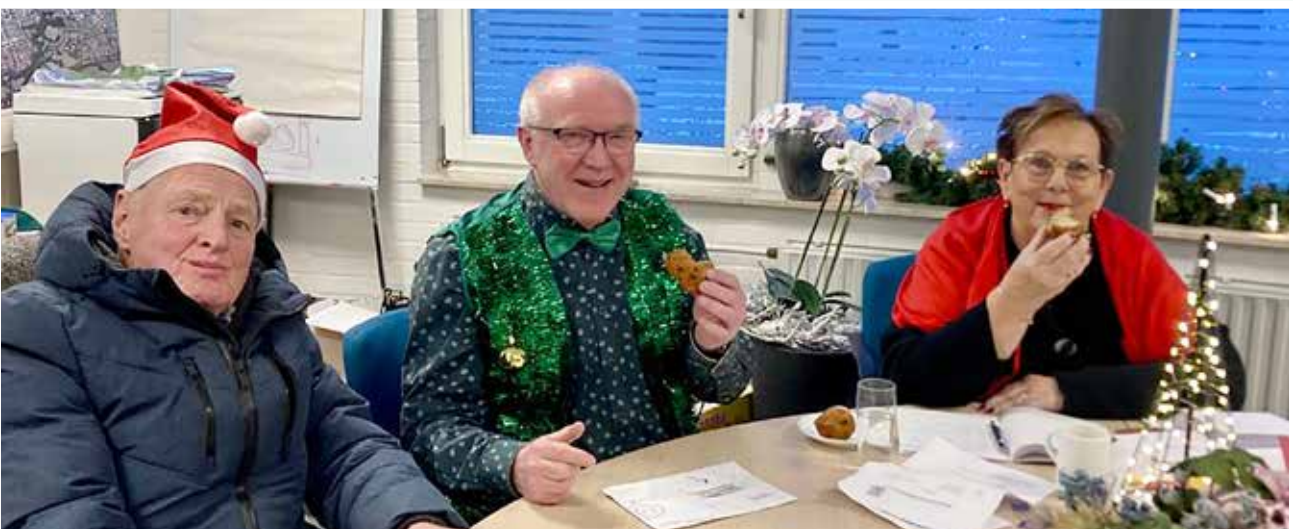
Kerstfeest wijkraad Wesselerbrink

Naast dit gezellige samenkomen was er ook een hartverwarmende actie aan verbonden: mensen konden van tevoren buurtbewoners aandragen voor een gratis kerststol via het initiatief 'Wie gun jij een kerststol?'. Zo kregen