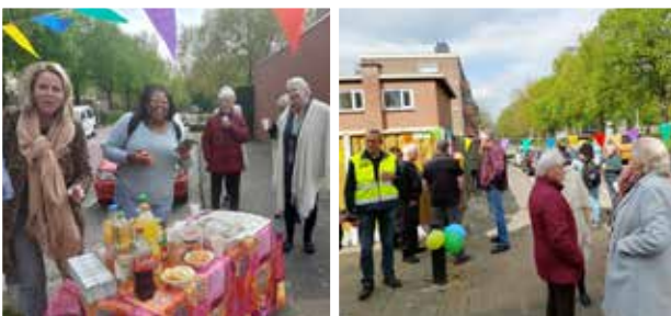
Collectieve vernieuwing schuttingen voormalige Vredesteinhuusjes