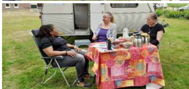
Presentie in de wijk: pop-up koffiecavan Torenflats