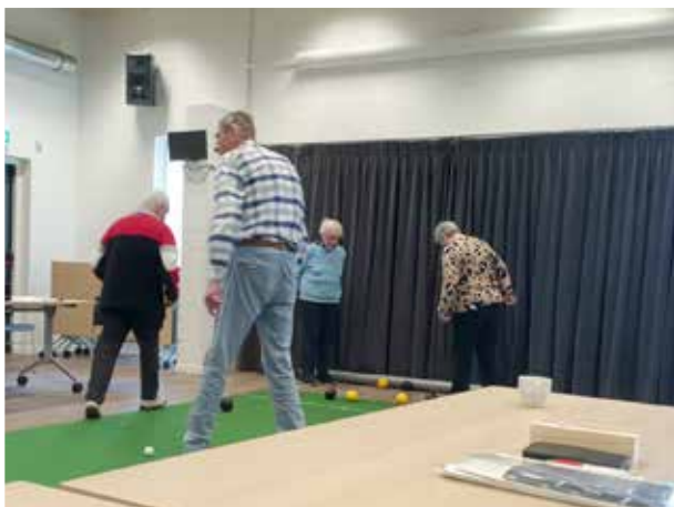
Koersbal in De Magneet

Een andere belangrijke samenwerkingsvorm is die met wooncorporaties, politie en de gemeente. Het gaat dan om ondersteuning bij burencollicten, verhuizingen of woningverbeteringen, persoonlijke begeleiding