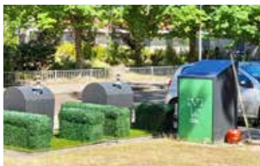
Situatie afvalcontainers, voor en na