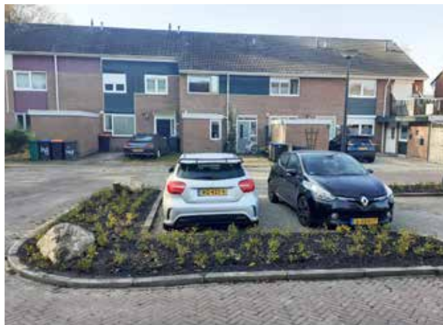
Nieuwe groenvoorziening Hesselinklanden