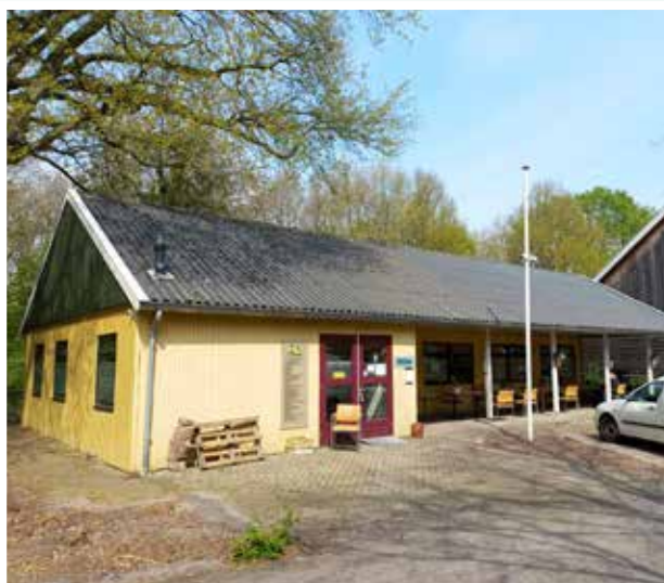
Smiley huidig gebouw

Stichting Smiley is druk bezig met een herontwikkeling en het zoeken van een tweede locatie waar wijkbewoners, kinderen en wijkwerkers activiteiten kunnen ontplooiën. Een van de Smiley vrijwilligers vertelt: "We kunnen heel veel zelf, maar soms is het fijn dat iemand meekijkt en meedenkt vanuit onze wensen. De herontwikkeling betreft een Smiley-veld waar nu nog drie kleine zeecontainers staan en een nieuw gebouw komt. We hopen dat we in het voorjaar van 2023 een tweede locatie vinden en dat er een mooi nieuw Smiley-veld komt. Wat 2023 verder brengt? We gaan ook dit jaar een aantal grotere activiteiten organiseren, zoals met Pasen, buitenspeeldagen, Halloween en ViVa. Hier komen vaak meer dan 300 mensen op af.