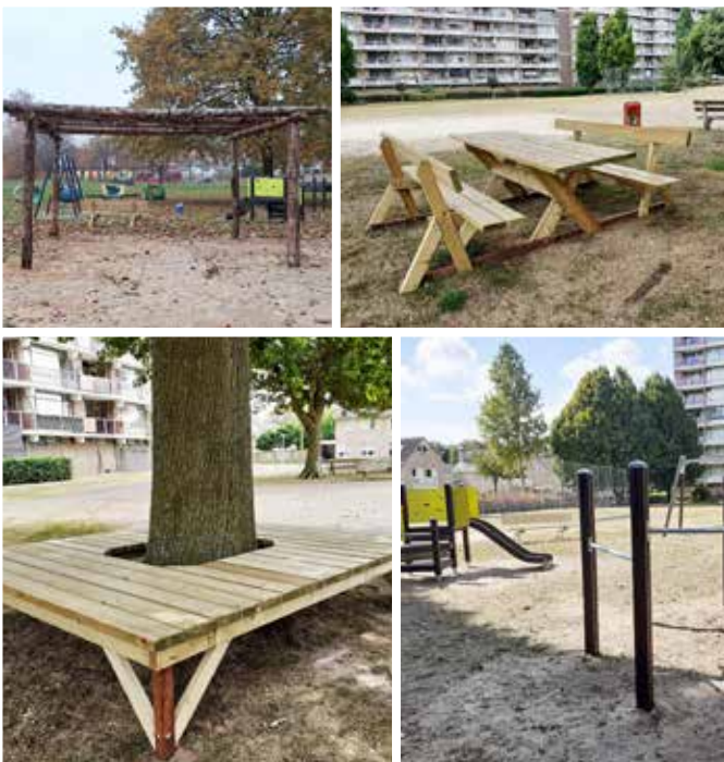
Nieuw entree grasveld tussen Flat 2 en 3 - Picknickbanken - Boombank Lintveldebrink - Nieuw Speeltoestellen Lintveldebrink