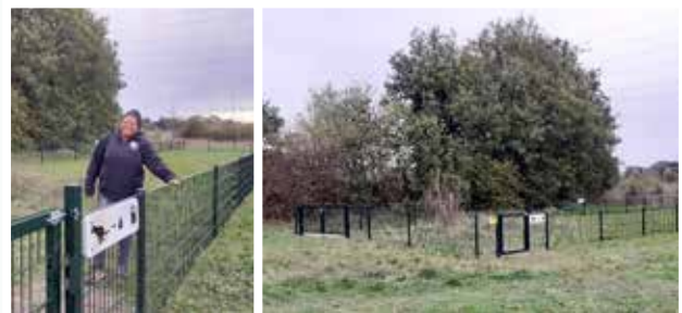
Hondenlosloopveld in Oost-Boswinkel