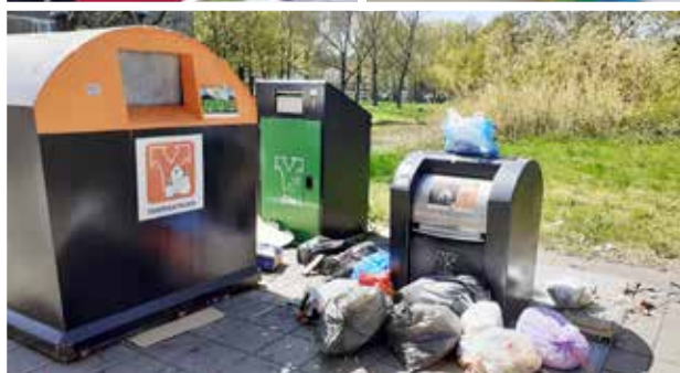
Collectieve aanpak afvalproblematiek Torenflats

De samenwerking met alle partijen verliep soepel en er is veel geleerd van elkaar. Onze aanbevelingen naar aanleiding van het buurtonderzoek zijn inmiddels gedeeld met de afdeling Strategie & Beleid van Twente Milieu. Een project dat dus ook in 2023 nog loopt.