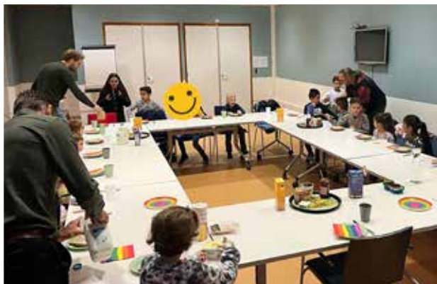
Schoolontbijt De Regenboog